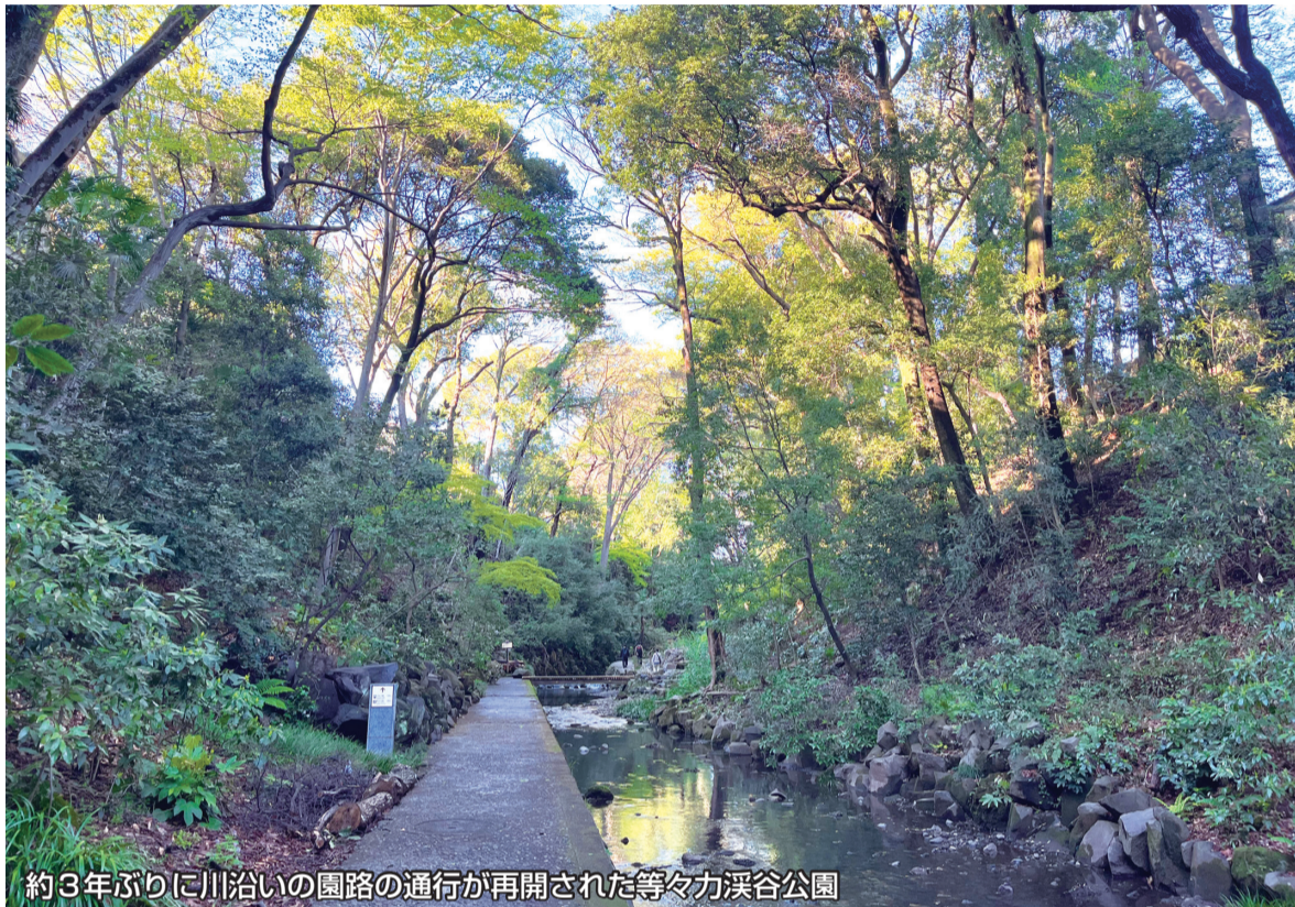
約3年ぶりに川沿いの園路の通行が再開された等々力溪谷公園