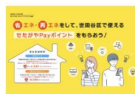
世田谷区 令和6年度 (2024年) 省エネ・再エネポイントアクション事業