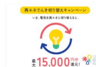
世田谷区 令和7年度 (2025年度) 第1回再エネでんき切り替えキャンペーン (過去の事例一覧参照)