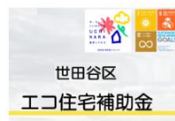
世田谷区 令和7年度 (2025年) エコ住宅補助金 (うち再エネ上乗せ補助金)