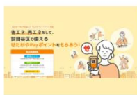
世田谷区 令和5年度 (2023年) 省エネ・再エネポイントアクション事業

過去に世田谷区より、再エネ切り替えに関わる補助・助成を受け取ったことがある方は、本補助制度の対象外となります。