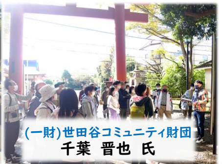
(一財)世田谷コミュニティ財団 千葉 晋也氏