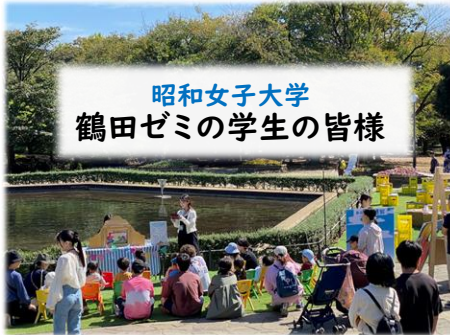
昭和女子大学 鶴田ゼミの学生の皆様