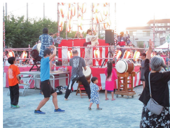
やぐら付近の様子