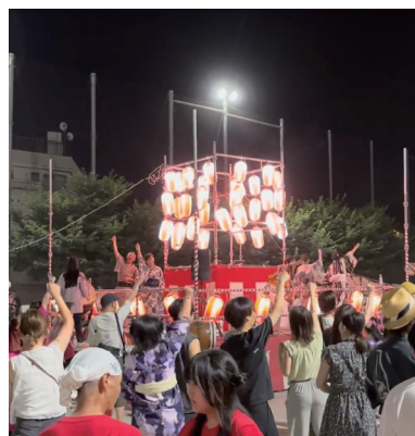
盆ディスコの盛り上がり