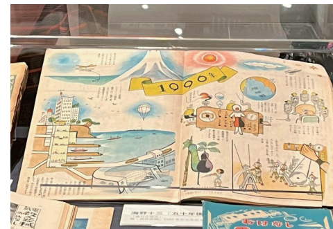
「五十年後(1996年)の日本」の図