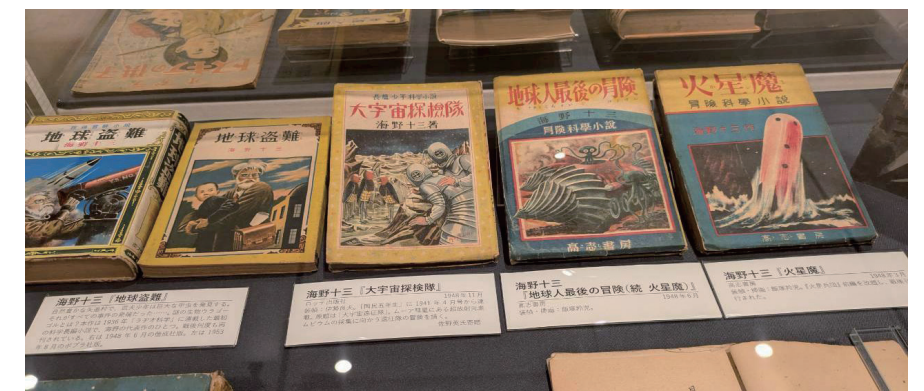
海野十三が執筆した少年向け空想科学小説の表紙