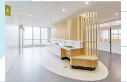
木材を使用した手洗場