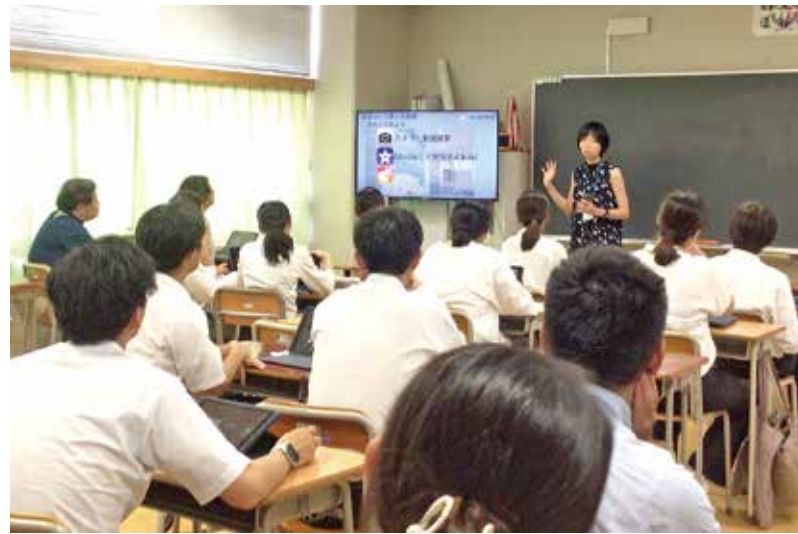
音楽作成アプリの実践事例紹介 及びワークショップ

先生方のICT活用スキルを向上し、子どもたちの学びの幅を広げ、深めるICTインフルエンサーの活動は、さらに重要になってくると考えています。今後もICTインフルエンサーの活動を拡充させ、子どもたちのよりよい学びの実現のために教育DXを推進していきます。