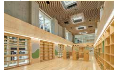
天窓から自然光が入る図書館

区立池之上小学校 は、令和6年6月に全面改築工事が終了し、2学期から新校舎での生活が始まりました。保育施設との複合化による地上4階建ての校舎で、プールを屋上に整備しました。学校のシンボルツリーであるアカマツや、サザエさんモザイク壁画も旧校舎から継承しています。