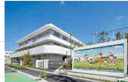
校舎とサザエさんモザイク壁画