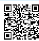
概要版パンフレット

教育目標「幸せな未来をデザインし、創造するせたがやの教育」と4つの基本方針を児童・生徒、保護者、地域の皆さんと共有するため「世田谷区の教育～世田谷区教育振興基本計画 令和6年度～10年度【概要版】」を作成しましたので、ぜひ下記の二次元コードよりご覧ください。