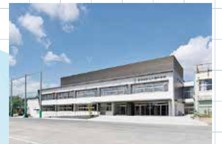
校庭から見た校舎

区立八幡中学校 は、令和6年9月に一部改築工事が終了し、2学期途中から新校舎での生活が始まりました。地上2階建ての校舎で、新たに給食室を設置し、自校調理方式へ移行しました。