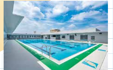
遮熱用庇を設置した屋上プール

区立八幡中学校 は、令和6年9月に一部改築工事が終了し、2学期途中から新校舎での生活が始まりました。地上2階建ての校舎で、新たに給食室を設置し、自校調理方式へ移行しました。