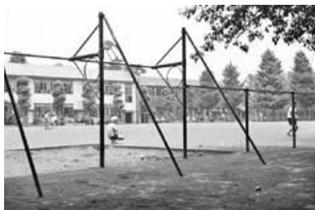
祖師谷小学校校庭