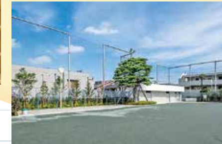
シンボルツリーのアカマツ

区立池之上小学校 は、令和6年6月に全面改築工事が終了し、2学期から新校舎での生活が始まりました。保育施設との複合化による地上4階建ての校舎で、プールを屋上に整備しました。学校のシンボルツリーであるアカマツや、サザエさんモザイク壁画も旧校舎から継承しています。