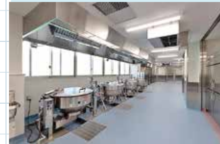
新たに設置した給食室