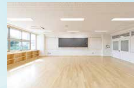
南向きの普通教室