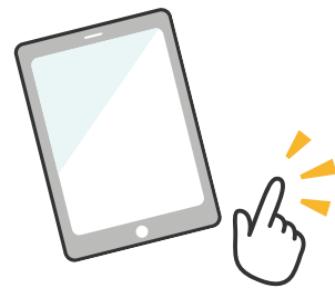
生成AIの活用実践事例紹介