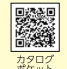
カタログ ポケット