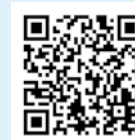
概要版リーフレット ルビあり