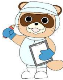
はさPOM 世田谷区HACCP推進キャラクター