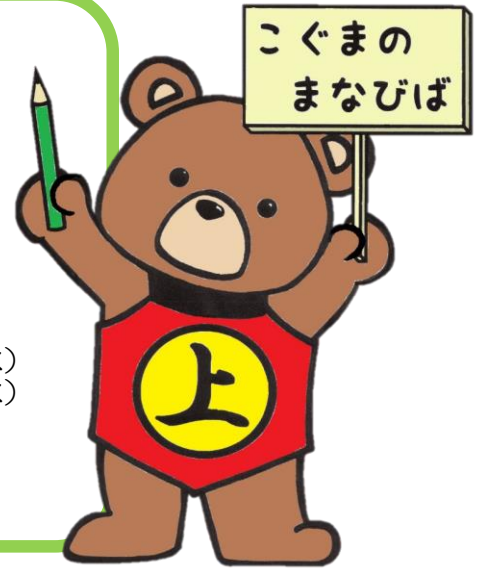
子どもの学び場運営スタートアップ事業