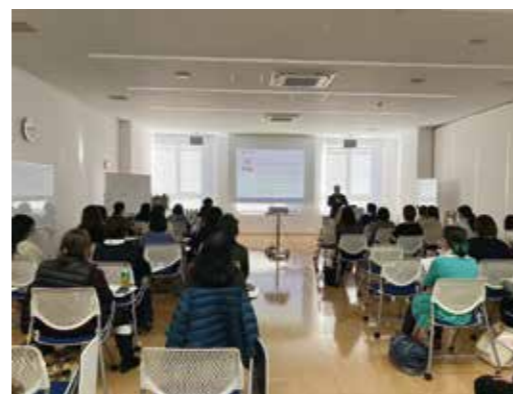
令和5年課題別研修 「ファシリテーション研修」