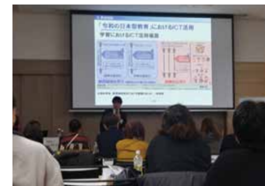
令和6年課題別研修 「ICT教育の現状と今後の展望」