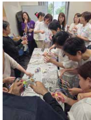
「くるくるレインボー」作り