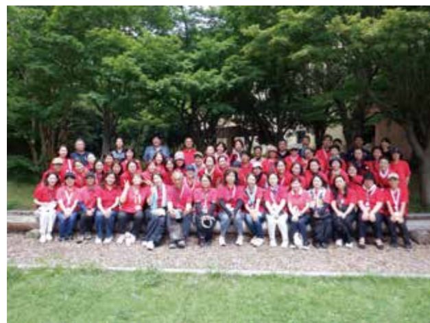
令和7年度 宿泊研修

今後も、青少年委員一人ひとりが成長を実感でき、委員同士のつながりを深められる「学びの場」となるよう、研修の企画・運営に励んでまいります。