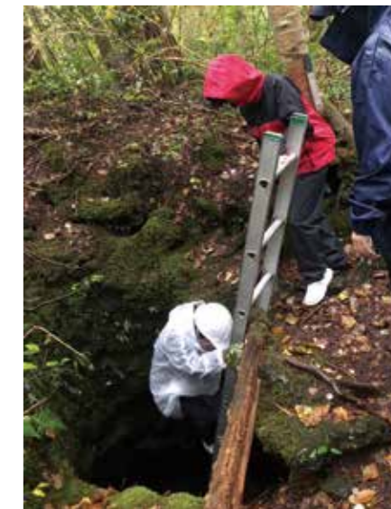
令和6年 日帰り研修 「河口湖フィールドセンター・ガイドウォーク」