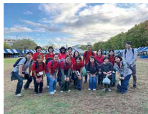
令和元年日帰り研修 「ミニいちかわ」