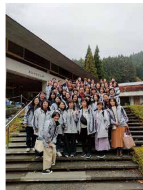
令和5年宿泊研修 「川場村ふじやまビレッジ」