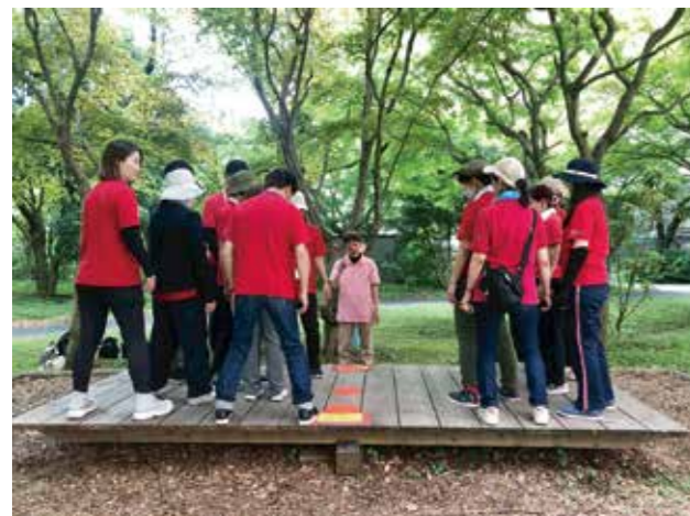
YCAP 体験型研修プログラム