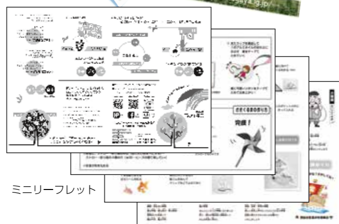
ミニリーフレット