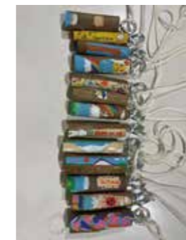
令和6年 日帰り研修 「河口湖フィールドセンター・バードコール作成」