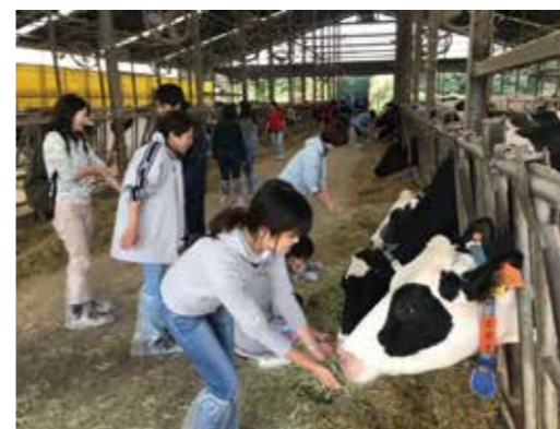
令和元年日帰り研修 「富士ミルクランド」