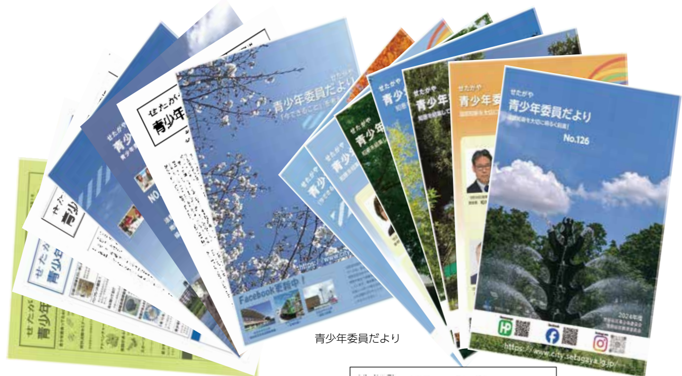
青少年委員だより

そして様々なSNSの普及に合わせて、FacebookやInstagramといったツールを使い新たな形で情報発信を行っています。