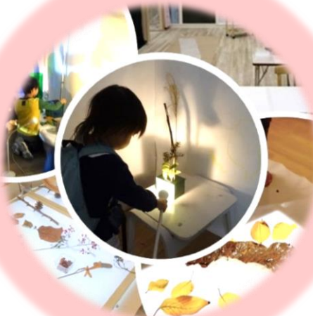
グラフィックと光のアトリエ