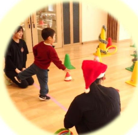
大学生とわくわく運動遊び （協力：日本女子体育大学）