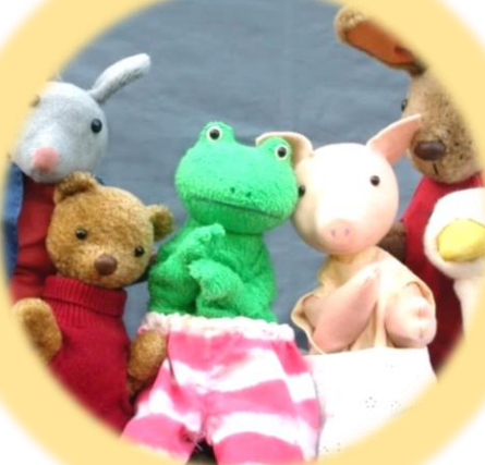
わくわく親子で人形劇場