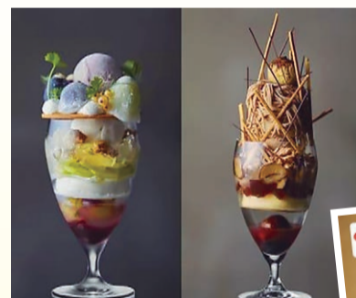
PÂTISSERIE ASAKO IWAYANAGI パルフェビジュウ®

また、あわせて世田谷区が行っている地域福祉・社会貢献型の取組みを紹介することで、区外の方からも寄附を通じた応援を募っています。