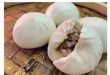
鹿港 手作り台湾肉包 (肉まん)