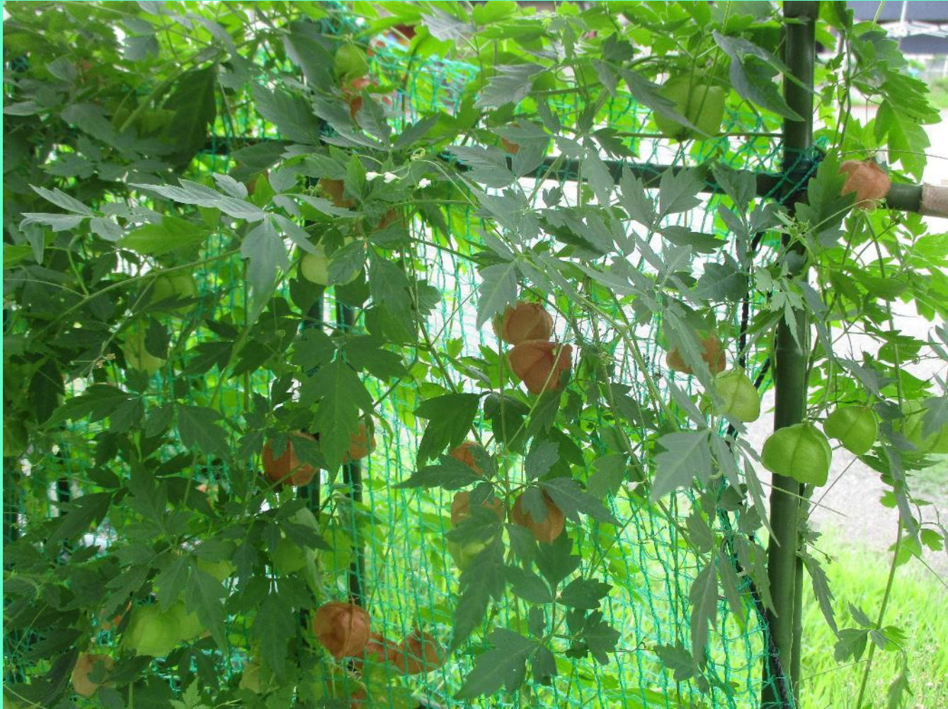
フウセンカズラの種が たくさんできています