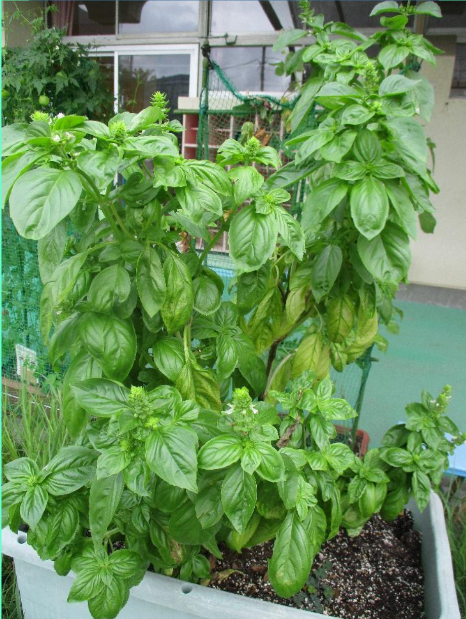
さくらんぼ組が植えた バジルが大きくなりました