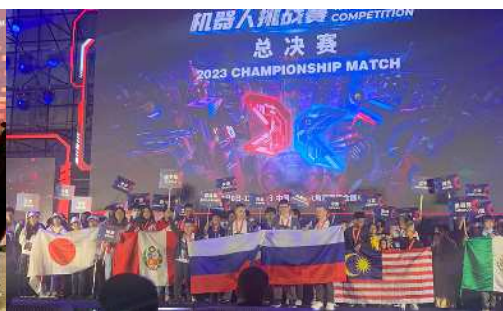
Make X 2023 開会式