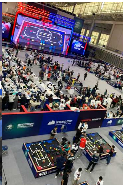
Make X 2024 深圳大会