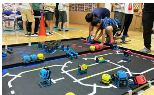
Make X 2024 東京大会