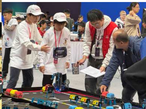
Make X 2024 深圳大会