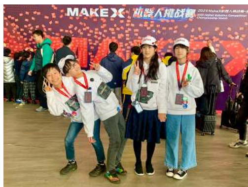
Make X 2023 煙台大会