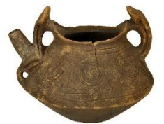
注口土器 4000年前縄文時代