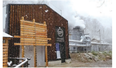
発電所「コミュニティ発電 せたがや・松之山温泉」

新潟県十日町市の日本三大薬湯「松之山温泉」の熱で作られた電気(地熱発電)を購入される方を募集します(募集数約80件)。