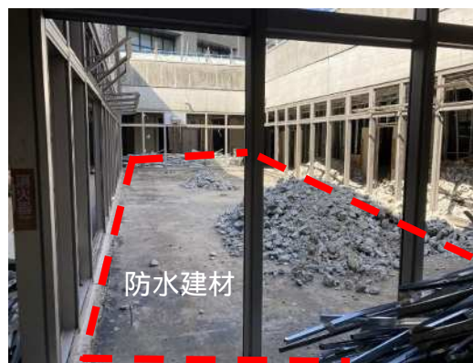
屋上防水建材 撤去前