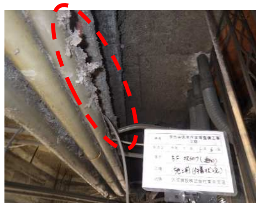
石綿含有建材 撤去前