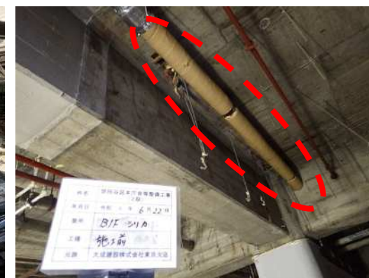
設備配管保温材 撤去前