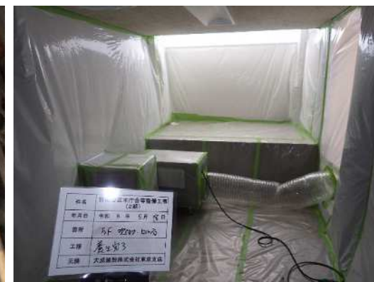
石綿含有建材 隔離養生