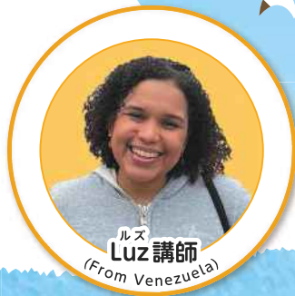
ルズ 講師 (From Venezuela)

外国人講師とふれあいながら保護者と共に 歌や手遊びなど遊び感覚で英語を楽しみます!!