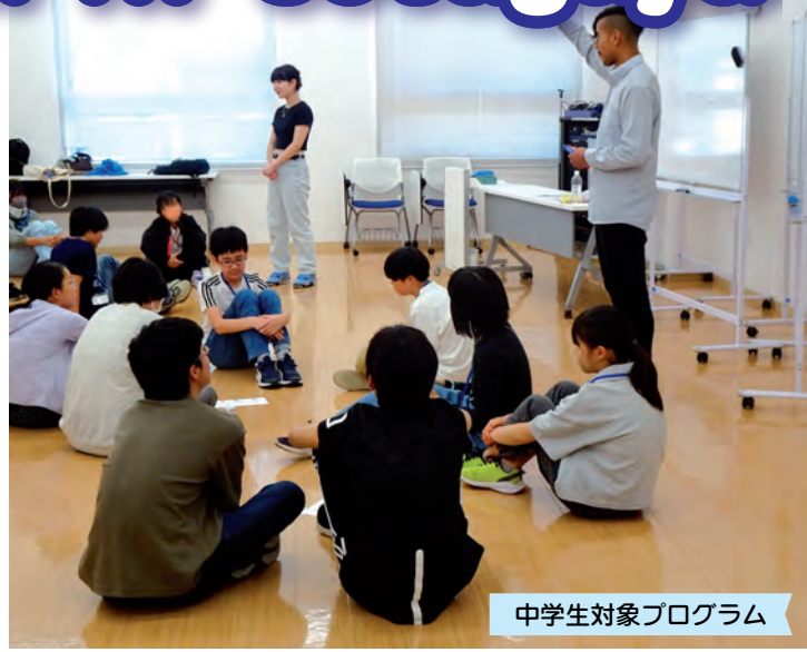
中学生対象プログラム

教育総合センター国際理解教育事業として、小・中学生及び高校生以上・社会人・シニアなど区民の皆様を対象に「英語オンリー」でのコミュニケーションを体験するプログラムを開催いたします。詳細は、区ホームページをご覧ください。