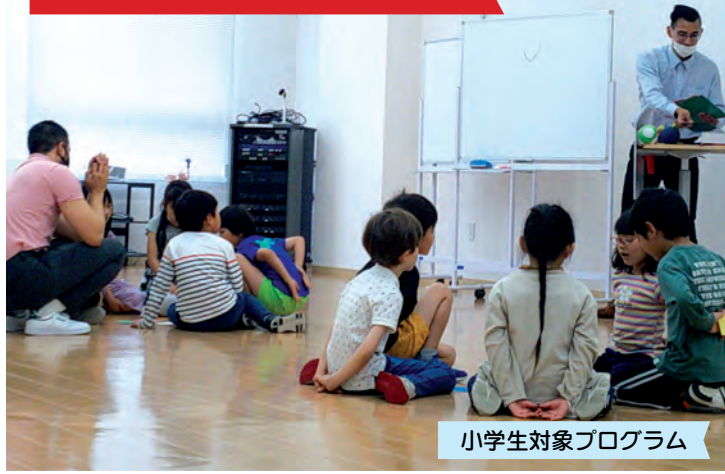
小学生対象プログラム