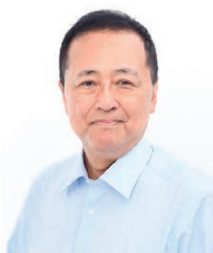
世田谷区長 のぶと 保坂展人

主な内容 ▶ 敷地に擁壁や斜面(がけ)をお持ちの方へ…3面 | せたがやそだち加工品ビジネスプランコンテスト入賞プランの紹介…8面 | 世田谷区民健康村から…8面