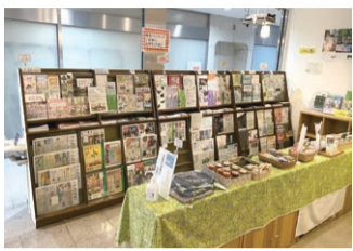
世田谷まちなか観光情報コーナー▶

世田谷まちなか観光情報コーナー(世田谷産業プラザ1階)では、区内の見どころや観光情報を紹介するパンフレット類を取りそろえています。無料Wi-Fiやカフェコーナー(喫茶JOY)もあり、数種類の世田谷みやげの商品等を販売しています。お支払いにはせたがやPayも使えます。まち歩きやお近くにお越しの際は、ぜひお立ち寄りください。