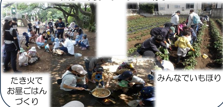
たき火で お昼ごはん づくり