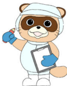
はさPOM 世田谷区HACCP推進キャラクター