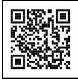
世田谷区ホームページ

本冊子の本文中、ホームページ参照の箇所には「ページID」を表記しています。 最新の情報は病児・病後児保育利用のご案内（ページID1547）でご確認ください。