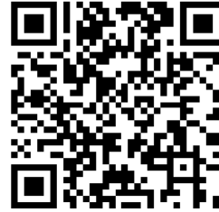
病児・病後児保育 利用のご案内 ページID 1547

掲載している情報は原則的に、令和7年12月現在のものです。 最新の情報は病児・病後児保育利用のご案内（ページID1547）でご確認ください。