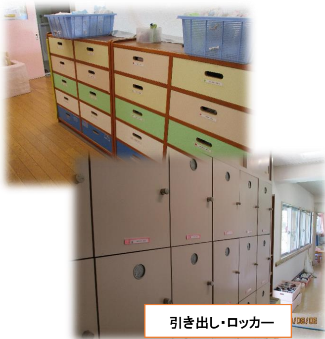
引き出し・ロッカー