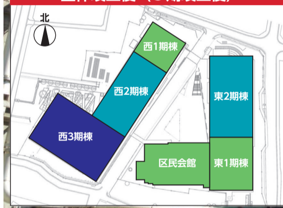
全体竣工後(3期竣工後)