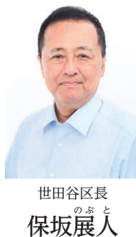
世田谷区長 のぶと 保坂展人

主な内容 30thキネコ国際映画祭…2面 | 十日町市産の電気を使いませんか…3面 | せたがや年末クリーンアップ作戦…8面