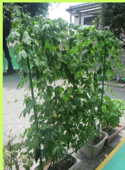
ゴーヤ(ちょっと苦かった)

一人ひとりで楽しめる遊び、友だちと一緒に楽しむ活動 クラスみんなで取り組む活動、さまざま経験します。