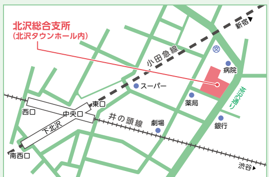
北沢2-8-18 (北沢タウンホール内)