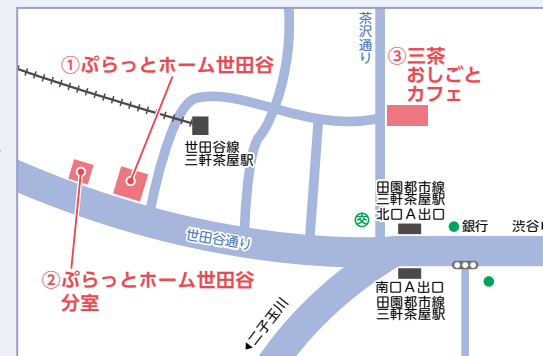
①太子堂4-3-1(3階) ②太子堂4-3-2(2階) ③太子堂2-16-7(2階)