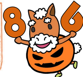
上馬地区キャラクター かみじいさん