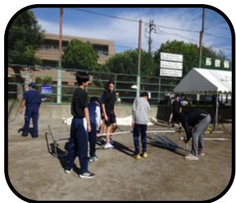
▼部員のみんでテント組み立て中

活動やこれから先の未来に活かしていきたいです。私達JRC部を支えてくださったみなさん本当にありがとうございました。 ※ふれあいフェスタ 地域の小泉公園で開催されているお祭り「小泉公園ふれあいフェスタ」 ※JRC 駒沢中学校の部活のひとつで、JUNIOR RED CROSS(青少年赤十字)の略。学校内外で様々なボランティア活動をしている。