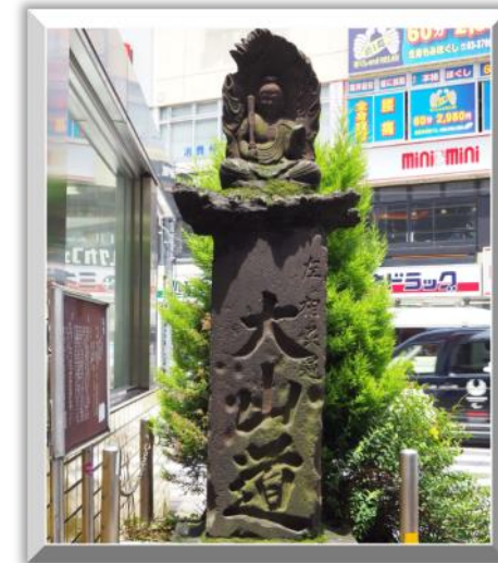
「旧道の四つ辻に建立された馬頭観音」 (川根正教さん)

古くからある道の四つ辻に祀られた馬頭観音。文化13(1816)年に上馬引沢村の人びとによって建立された。「あわしまみち」と刻まれ、道標も兼ねている。