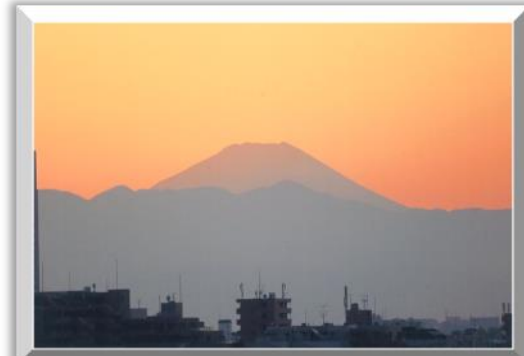
「上馬からの赤富士」 (平石忠秋さん)