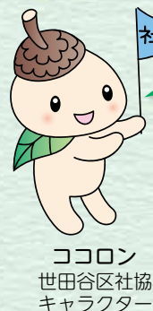
ココロン 世田谷区社協 キャラクター