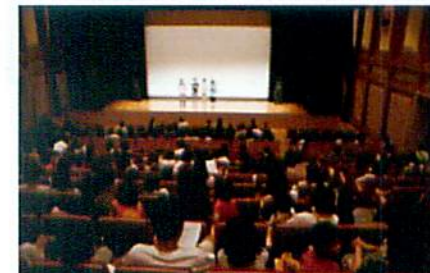
司会も会場整理も中学生ボランティア