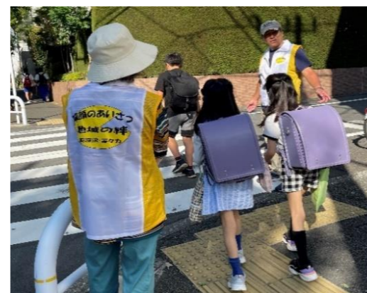
あいさつ運動の様子