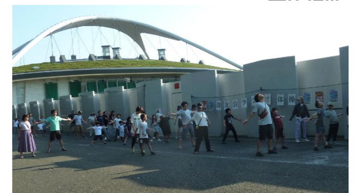
夏休みラジオ体操の様子