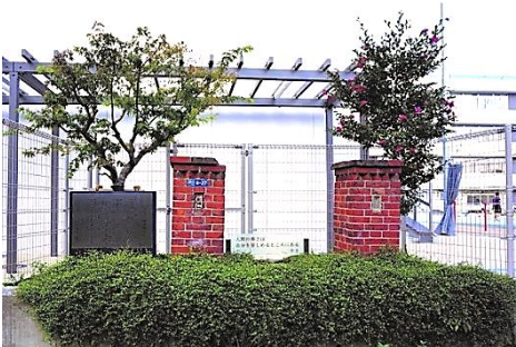
安吾の門ともみじの木(左)

でもスムーズに融合でき るよう二年間かけて、学 年交流をするなど準備を 重ねてきました。その結果 大きな混乱もなく、二つの 学校が融合できたと思っ ています。 今の代沢小の三年生まで は、その花見堂校舎で入学 式を迎えていて、まさにそ こがスタートの地になっ ています。実はこの度、そこ で生活していたことを忘れ ないため、校庭裏にあった もみじの木を安吾の門の横 に移植してあります。