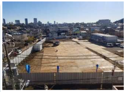
11/19 現在の代沢小学校(茶沢通り側から)