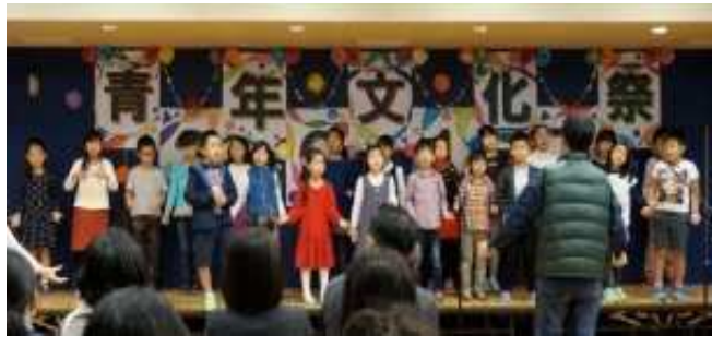
オープニングの様子

11月5日(日)青少年交流センター・池之上青少年会館の一大イベントである「第36回青年文化祭」が表記のテーマで開催されました。これは学生6人の実行委員を中心に多くの若者たちが企画したものです。