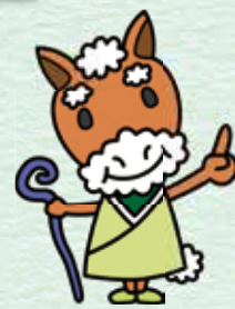
かみじいさん 上馬地区キャラクター