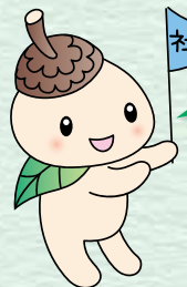
ココロン 世田谷区社協 キャラクター

社会福祉協議会は、誰もが地域で安心して住み続けられるよう住民の皆さまと共に、福祉のまちづくりを進めています。