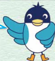
あんすこ君 あんしんすこやかセンター イメージキャラクター