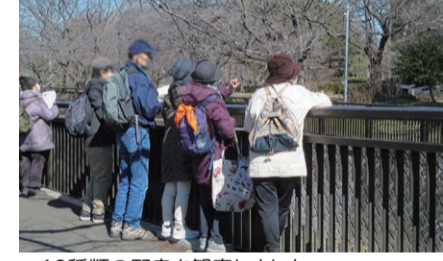
▲19種類の野鳥を観察しました

2月25日に、仙川に沿って歩きながら野鳥の観察と周辺の歴史を学ぶ講座を実施しました。 問 地域振興課 ☎3326-9376 FAX3326-1050