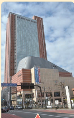
三軒茶屋交差点 付近の様子 (昭和30年代~現在)