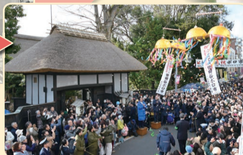
世田谷ボロ市の様子 (昭和30年代~令和元年)