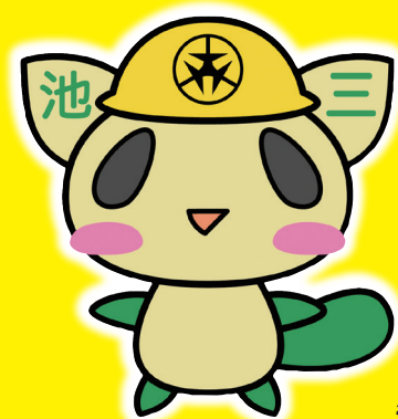
池尻・三宿地区キャラクター みいけ