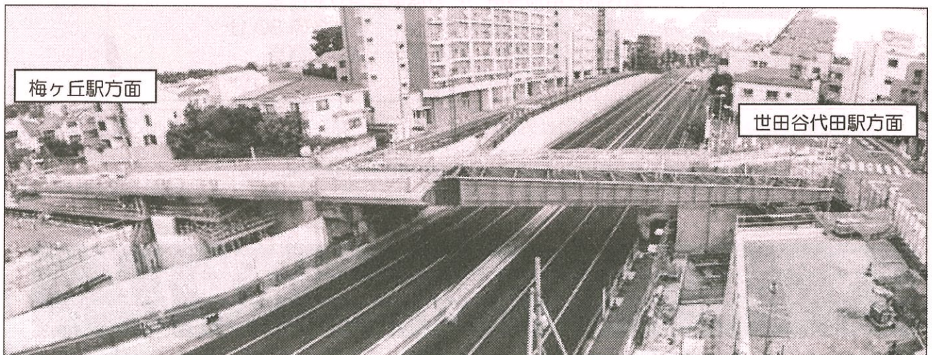
環状七号線横断橋の架設風景（環状七号線世田谷代田駅付近より撮影）