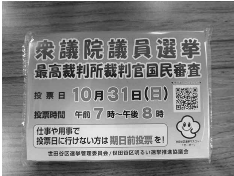
ポケットティッシュ（世田谷区選管作成）