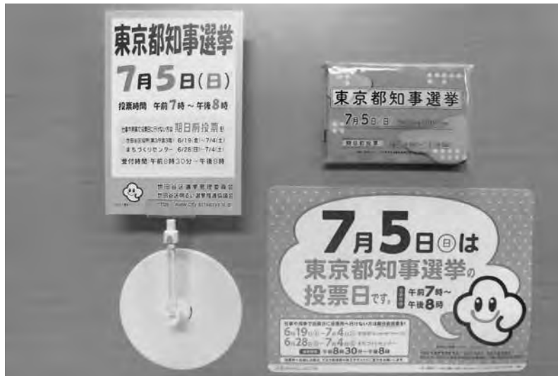
ポップスタンド、ポケットティッシュ（都選管作成）、テーブルステッカー