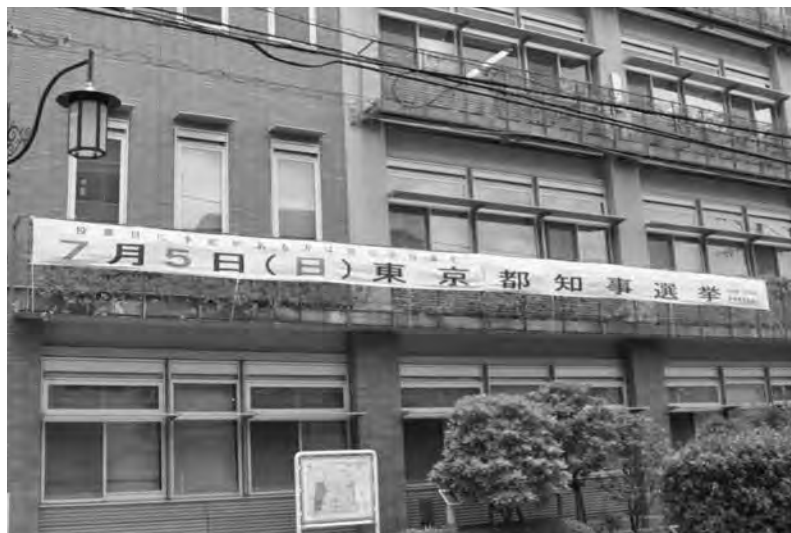
横断幕（砧総合支所）