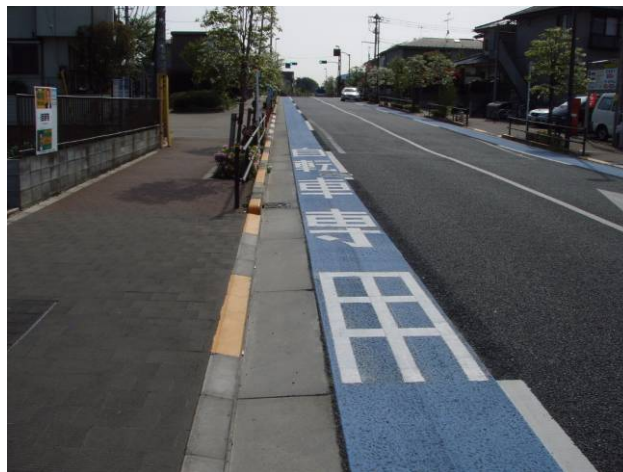
図 4-1 自転車専用通行帯の整備事例(補助 54 号線・桜上水三丁目)

各都道府県公安委員会の交通規制により、車両通行帯を普通自転車の専用通行帯として指定する形態である。