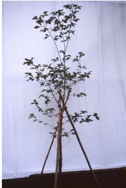
【被爆二世の木・柿】

平成4年に児童文学作家故大川悦生氏より被爆二世のアオギリ、柿の木は寄贈され、平成7年に世田谷公園に植樹しました。アオギリの木は、昭和20年8月6日に広島市に原子爆弾が投下されたときに被爆した木の二世で、柿の木は、昭和20年8月9日に長崎市に原子爆弾が投下されたときに被爆した木の二世です。