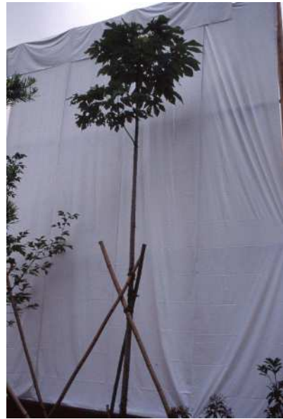
【被爆二世の木・アオギリ】