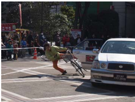
スタントマンによる安全運転の啓発