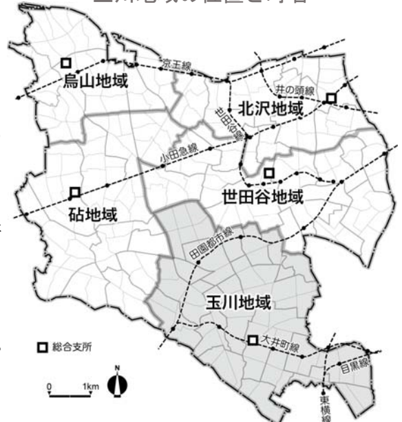
玉川地域の位置と町名

○地域には、東京23区唯一の溪谷で、東京都指定名勝の等々力溪谷があり、身近で自然に触れあえる場所として、区内外から多くの人を訪れます。また、五島美術館や宮本三郎記念美術館、長谷川町子美術館などの文化施設も数多くあります。