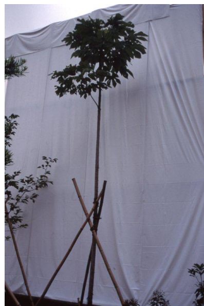
【被爆二世の木・アオギリ】