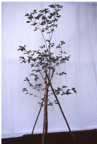
【被爆二世の木・柿】

平成4年に児童文学作家故大川悦生氏より被爆二世のアオギリ、柿の木は寄贈され、平成7年に世田谷公園に植樹しました。アオギリの木は、昭和20年8月6日に広島市に原子爆弾が投下されたときに被爆した木の二世で、柿の木は、昭和20年8月9日に長崎市に原子爆弾が投下されたときに被爆した木の二世です。