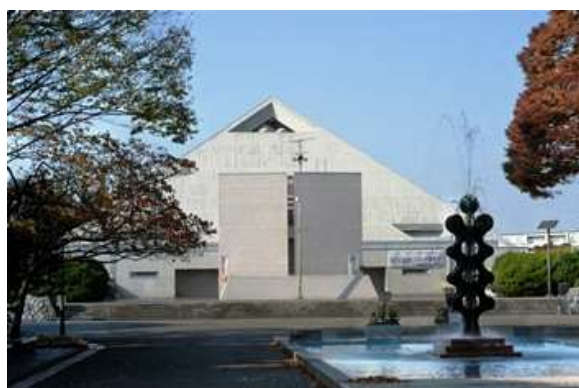
総合運動場（体育館）

今後、総合運動場及び大蔵第二運動場については、88万区民を有する世田谷に相応しい、区民の誰もが、自らがスポーツをして楽しみ、あるいは観て楽しむことができる、多様なスポーツレベルに対応する施設づくりを目指し、施設の一体化を基本とした、「大蔵運動施設整備計画」を別途策定し、再整備を進めていきます。