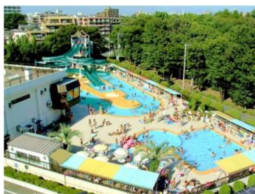
大蔵第二運動場（屋外プール）