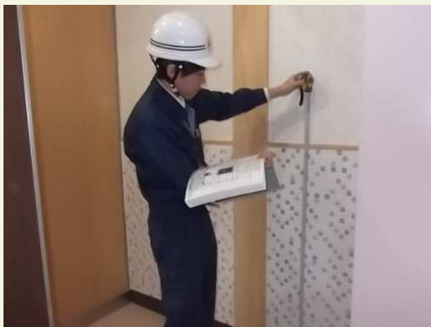
工事の品質管理を行うのも 大切な業務のひとつです。

また何より自分が作ったものに対して、その施設を利用する方から「ありがとう」の言葉を貰えることはこの仕事の一番のやりがいだと感じています。施設管理者からの相談に区内を奔走する日々ですが、区民の安全・安心のため責任感をもって職務に当たっていきます。