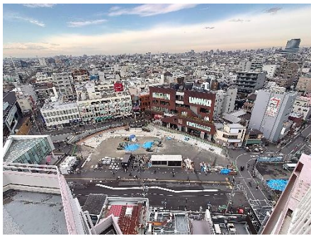
工事の様子(令和6年1月24日)

令和6年1月30日(火)に北沢総合支所の街づくり課、拠点整備担当課を訪れ、下北沢駅前工事の進捗状況をうかがいました。 また、代沢地区にある道路、補助26号線のこれからについてもお聞きしました。 なぜ道路整備工事をするのかについても知ることができ、有意義な時間でした。